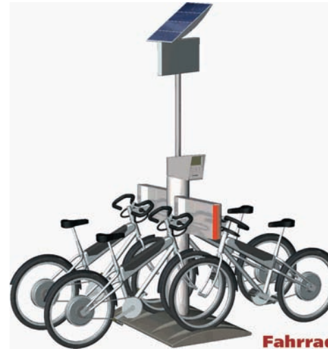
Fahrradmietpunkt – Die flexible Fahrradvermietung

In Kombination mit der energieautarken Solartankstelle der SOLON Mobility GmbH entsteht ein robustes und universell einsetzbares Nahverkehrssystem, das sich insbesondere für den Einsatz in Entwicklungs- und Schwellenländern eignet.