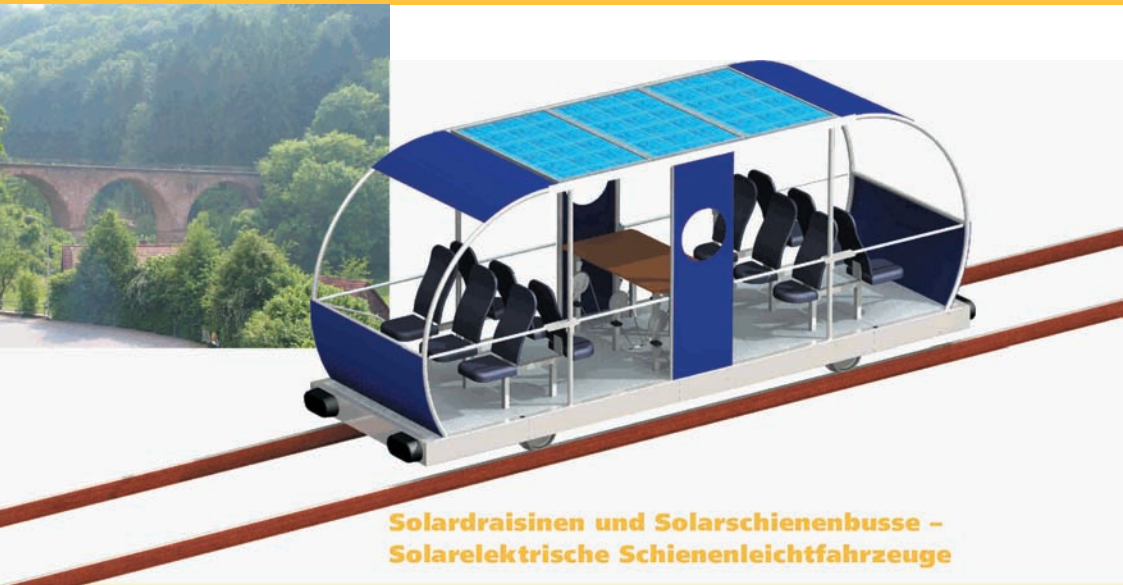
Solardraisinen und Solarschienenbusse – Solarelektrische Schienenleichtfahrzeuge

Mit unserer Solardraisinenteknik wird erstmalig ein solarer pedalelektrischer Antrieb auf der Schiene eingeführt. Die Verbindung von Sonnen- und Muskelkraft ermöglicht ein neuartiges Fahrerlebnis. Ein Spaß für Jung und Alt.